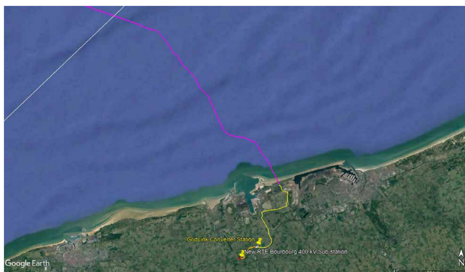
Le tracé de la liaison sous-marine GridLink

Avant de soumettre ces demandes d'autorisation, les maîtres d'ouvrage sollicitent le point de vue du public. Cette exposition virtuelle vous offre l'opportunité d'en savoir plus sur le projet et de donner votre avis sur les propositions.