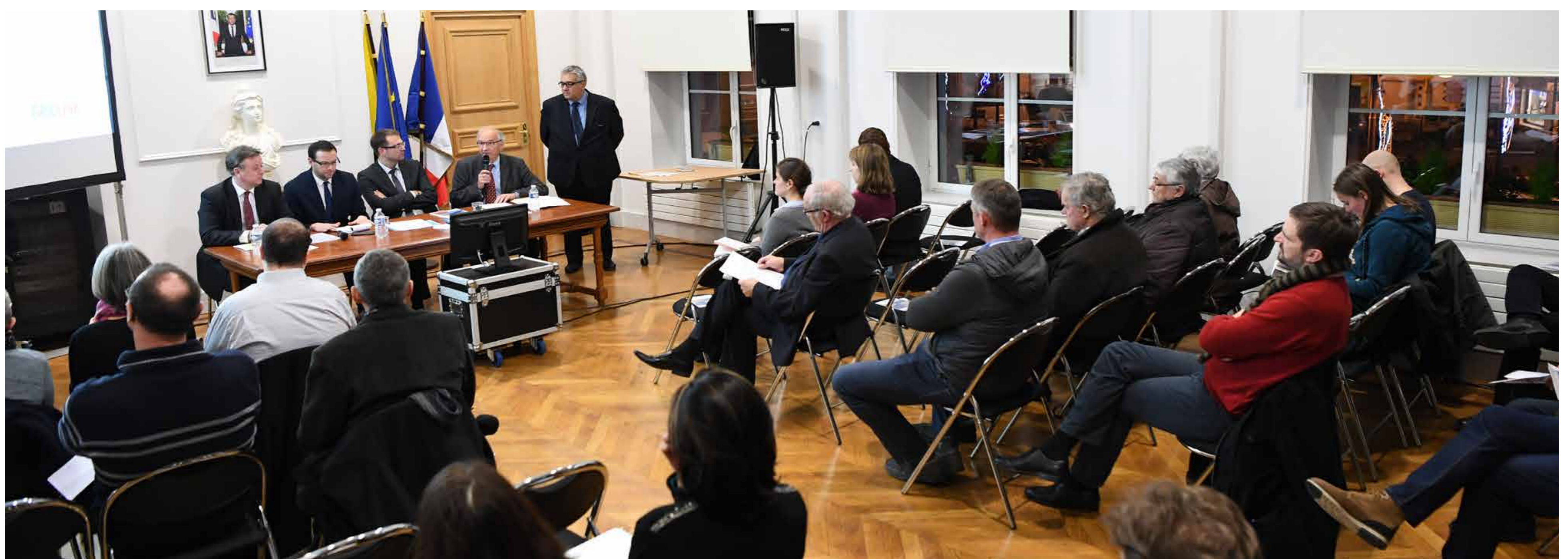
Participez à nos réunions publiques