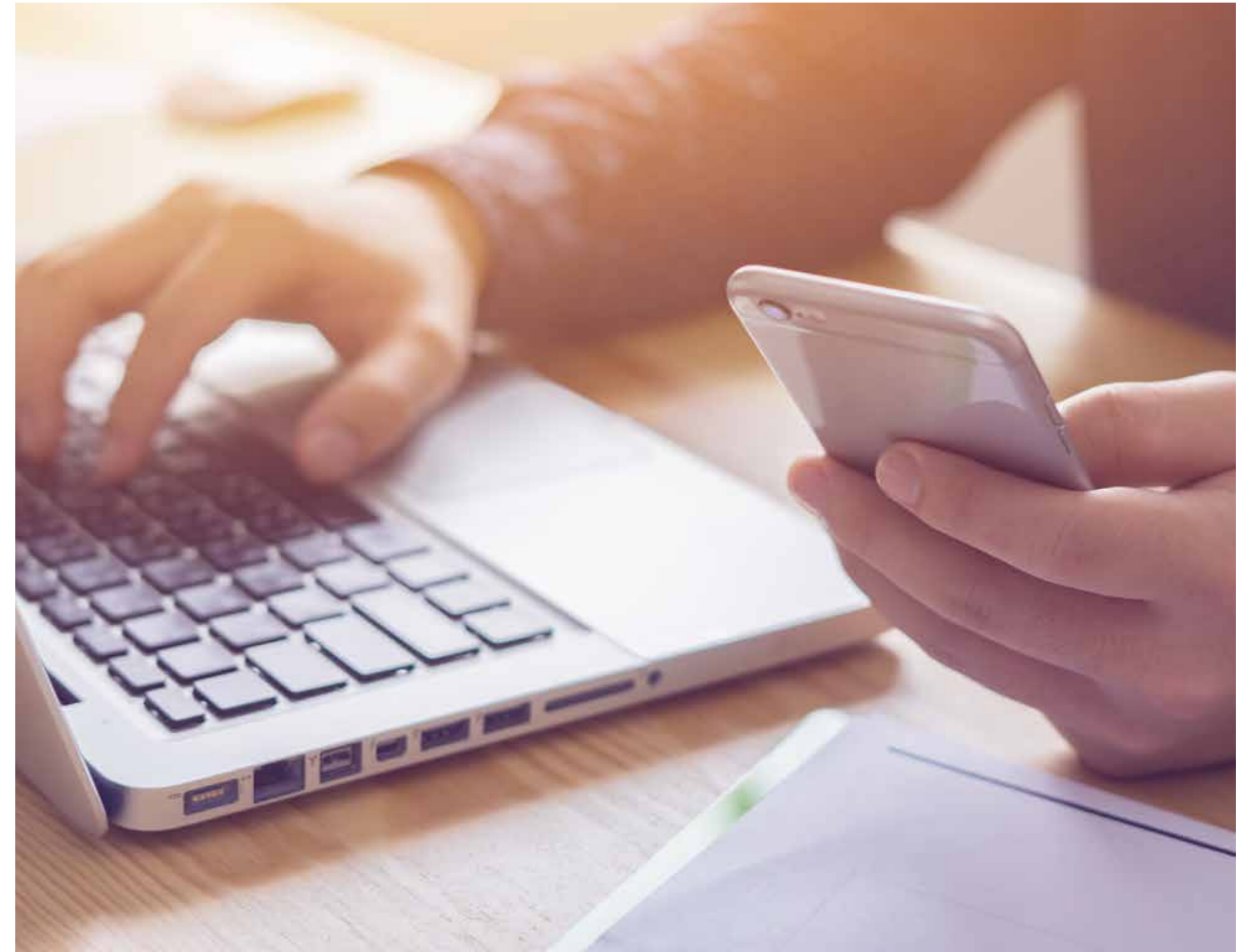
Consulter les informations sur le projet en ligne